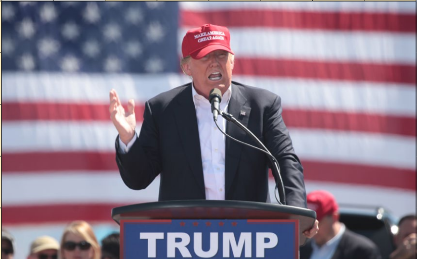
Konstruktör: Björn Magnusson, Gangster Media AB.